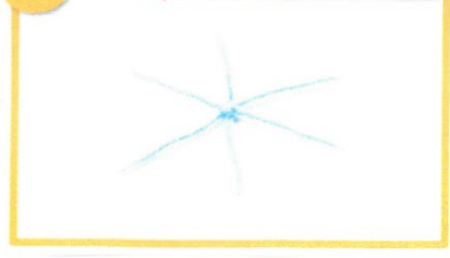
雪の結晶オナメント