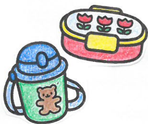
お弁当箱やタッパ 水筒

お荷物の間違い防止のため、持ちものすべてに名前の記入をお願いしております。ご協力よろしくお願い致します。